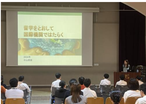
中山先生講演風景

https://www.youtube.com/watch?app=desktop&v=aQkbPfwzDI