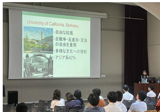
中山先生講演風景